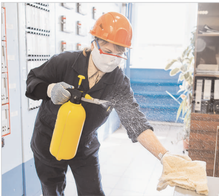
Санобработка в цехе E-1-9.

- Работа курьерской службы и прием корреспонденции.