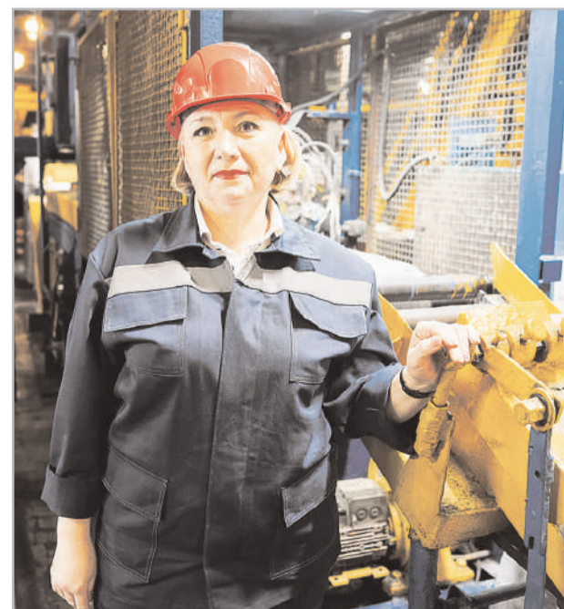
Почетными грамотами, выносили благодарности.