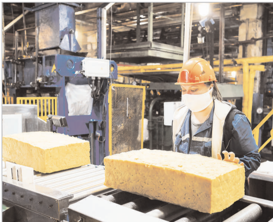
Производство каучука в цехе Е-2.

Сегодня новый дружный коллектив цеха Е-2 продолжает замечательную историю, начатую "пионерами" производства синтетического каучука в Стерлитамаке.