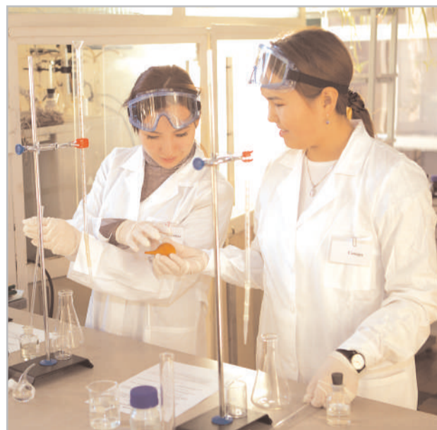
Задание получено, за работу!