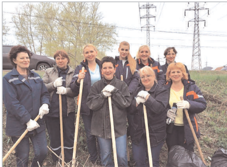
Сотрудники отдела анализа расходов сырьевых и энергетических ресурсов ООО "УК ТАУ" НефтеХим убирают закрепленную за подразделением территорию.

Каждую весну работники предприятий Группы компаний "ТАУ" участвуют в экологической акции по благоустройству и санитарной очистке заводских территорий от накопившегося за зиму мусора, проводят покос травы, вырубку деревьев и кустарников по охраняемому периметру, генеральную уборку кабинетов. А еще помогают коммунальным службам города привести в порядок улицы, парки и скверы, расположенные вдоль ул. Худайбердина и проспекта Октября. В нынешнем году силами наших сотрудников собрано и вывезено более 100 тонн мусора.