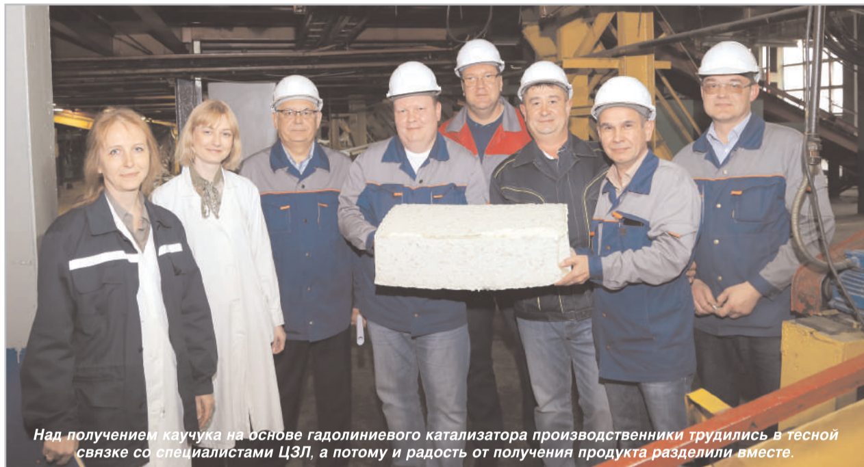
Над получением каучука на основе гадолиниевого катализатора производственники трудились в тесной связке со специалистами ЦЗЛ, а потому и радость от получения продукта разделили вместе.