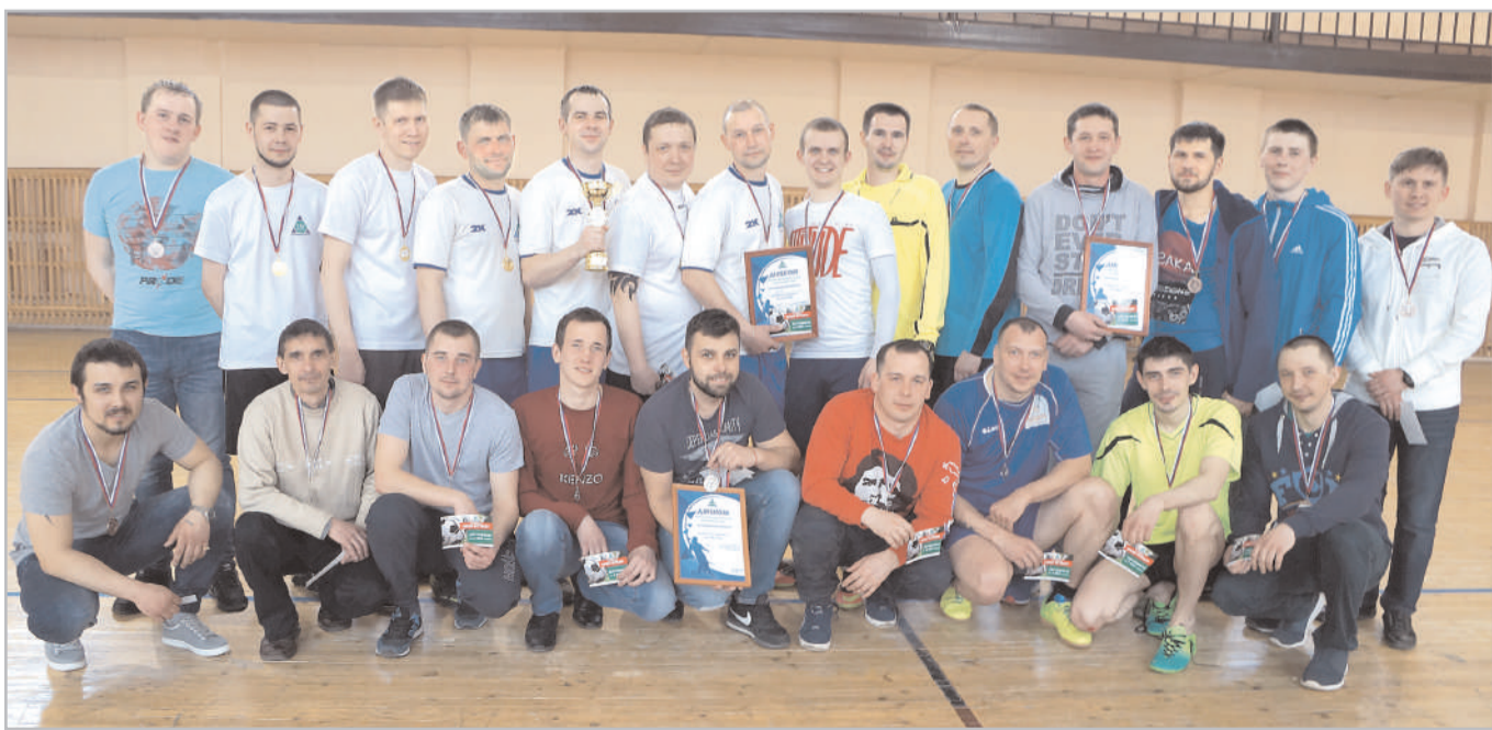
Вот они - победители и призеры корпоративного чемпионата по мини-футболу на приз Группы компаний "ТАУ". Больше фотографий в нашей официальной группе ВКонтакте https://vk.com/gktau .