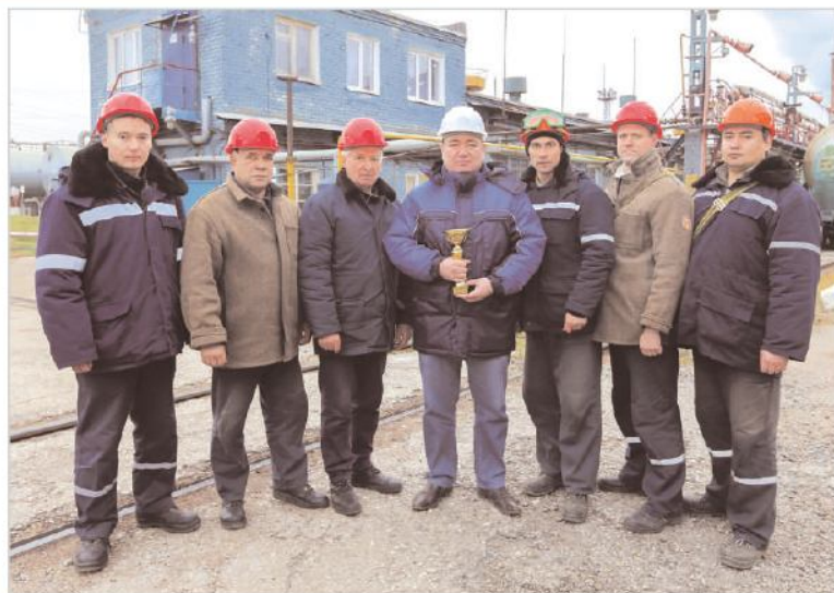
< В операторной цеха И-5в акционерного общества "Синтез-Каучук"

В поисках резервов для увеличения производительности акционерных обществ "Синтез-Каучук" и "Стерлитамакский нефтехимический завод" был взят курс на переработку и реализацию некондиционной продукции, хранящейся на складе, утилизацию ненужного. Сотрудники цехов провели огромную работу по сортировке и составлению списков всех имеющихся в цехах предметов, - материалов, инструментов, запасных частей и оборудования, хозяйственно-