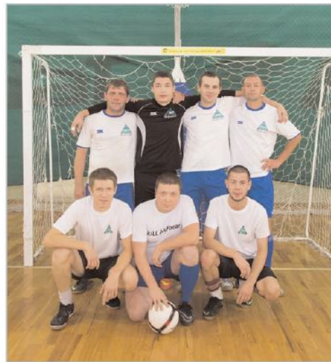
ды "Сырьевой компании" и МУП "СТУ", последняя отыграла пятое место.

В "утешительном" финале встретились коман-