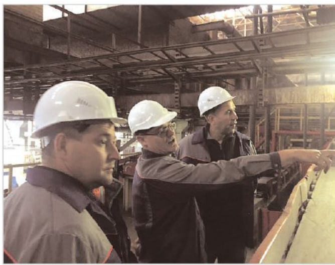
Партнеры посетили цех готовой продукции И-5в, где ознакомились с производством полиизопрена.

"УК ТАУ НефтеХим", гости отметили положительные моменты в развитии АО "Синтез-Каучук" и АО "СНХЗ", готовность вкладывать солидные инвестиции в обучение персонала, обновление оборудования и совершенствование технологий и обсудили возможность продления партнерских отношений на годы вперед.