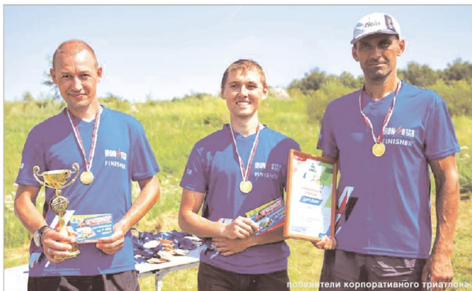
победители корпоративного триатлона