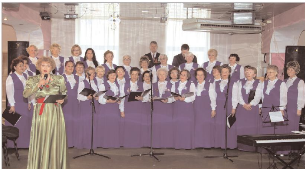
Фото с юбилейного концерта.

Для любого творческого коллектива дата в тридцать лет свидетельствует о его зрелости, состоятельности, успешности. А причина последнего не в его "народности", а в людях, живущих музыкой. Для ветеранов каждое выступление, это - событие, преображающее всех его участников, придающее блеск молодому сердцу, стоит только ступить на сцену и взять первые ноты под аккомпанемент аккордеона. И не важно, что потом опять догонят "болячки", а правнуки, переживая, на всякий случай придут за бабушкой или дедушкой, - обязательно прозвучит вопрос: "А когда репетиция?". И можно не сомневаться, что она обязательно состоится!