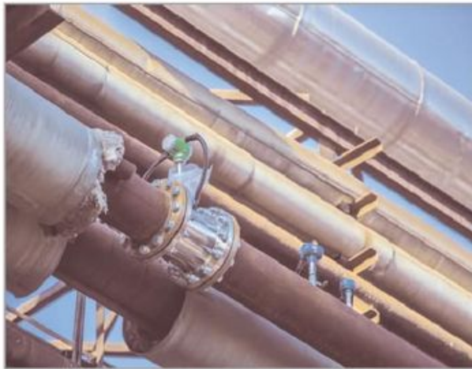
отд. И-1а ЦСН№2 и отд. Н-1-1а цеха Н-1-1а-12 ОАО "СНХЗ".

Для повышения эффективности энергосбережения, устранения тепловых потерь при транспортировке пара с нефтехимической площадки в цех сырья №2 ОАО "Синтез-Каучук", где он используется для разогрева продукта, была разработана новая схема подачи энергоресурса. В 2015 году согласно проекту смонтировали переключку в районе корпуса Н-10, а в октябре нынешнего года оснастили современными приборами учета пара