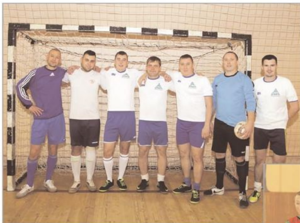
Сборная команда "ТАУ НефтеХим" по мини-футболу - в фаворитах турнира.

Чуть менее трагично завершился и следующий матч со сборной коман-