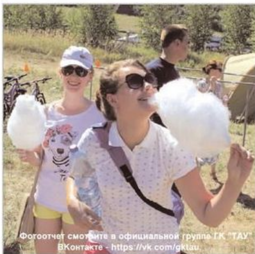
Фотоотчет смотрите в официальной группе ГК "ТАУ" ВКонтакте - https://vk.com/gklau

Поздравляем с личными достижениями всех участников триатлона на приз Группы компаний "ТАУ"!