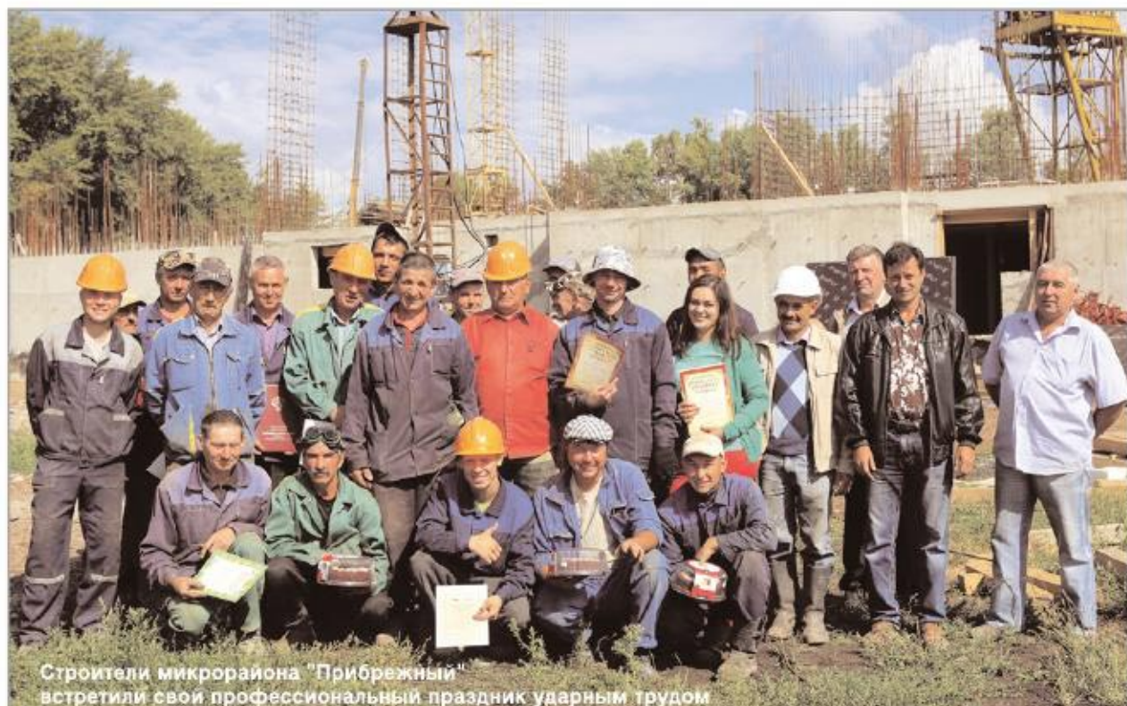
Строители микрорайона "Прибрежный" встретили свой профессиональный праздник ударным трудом