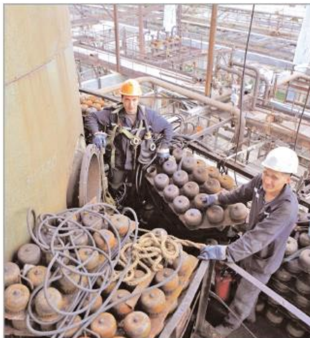
Ремонт колонны ректификации поз. 25/2 в отделе И-7 цеха И-7-10 акционерного общества "Синтез-Каучук"