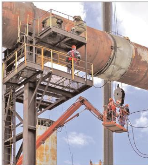
Монтажная бригада ВНЗМ-1 (г. Салават) производит замену участка воздуховода из цеха И-5в в цех ИП-6а

- В капитальный ремонт проявляются самые лучшие качества людей. За редким исключением