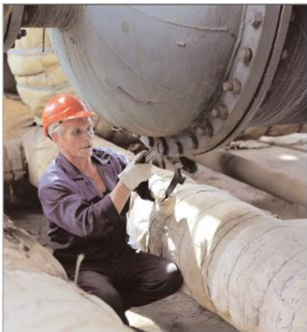
Закрытие крышки конденсатора поз. 111/2 в цехе И-2 производят специалисты по межремонтному обслуживанию ООО "Химремонт"