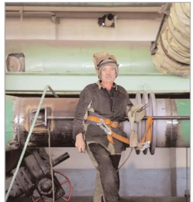
Замена компенсатора на трубопроводе циркуляционной воды в цехе И-2 производится специалистами подразделения РТО ООО "Химремонт"