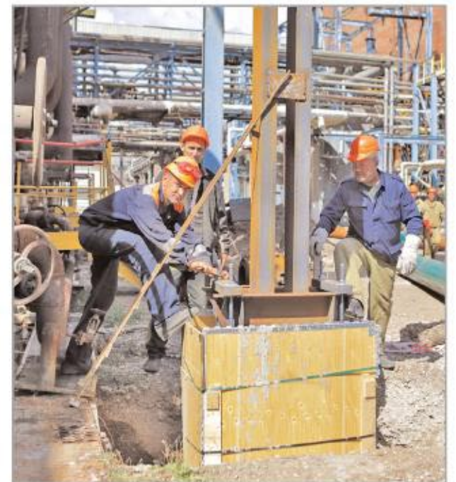
Работники ООО "Уралтехстрой" монтируют коллектор промоборотной воды на наружную установку цеха И-5в (установка опоры)

Ну, а по завершении всех работ, непременно соберем технических специалистов, чтобы проанализировать организационные недочеты и не допустить их в будущем.