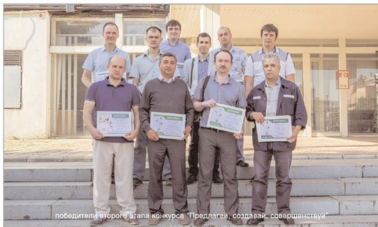
победители второго этапа конкурса "Предлагай, создавай, совершенствуй"

Безусловно, запуск производства шин японской компании на российской земле обеспечит дальнейшее развитие отечественной автомобильной промышленности и добавит стабильности экономике наших нефтехимических предприятий.