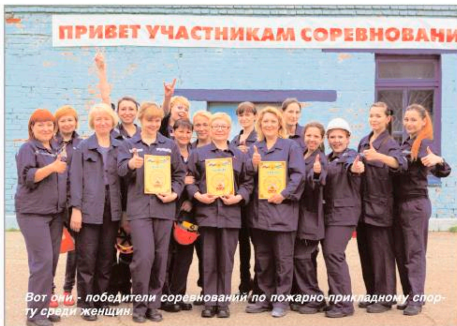
Вот они - победители соревнований по пожарно-прикладному спорту среди женщин.

По традиции соревнования открыли мужские команды. Двадцать восемь команд проходили этап за этапом, прокладывая рукавные линии, сбивая мишени струей воды из брандспойта, туша огонь с помощью огнетушителя и подручных средств. Уровень подготовки участников соревнований был настолько высок, что показанное ими на финише время, отличалось секундами. А потому при подведении итогов жюри учитывало также "чистоту" выполнения упражнений, уверенность в применении средств пожаротушения и, конечно, слаженность действий всех