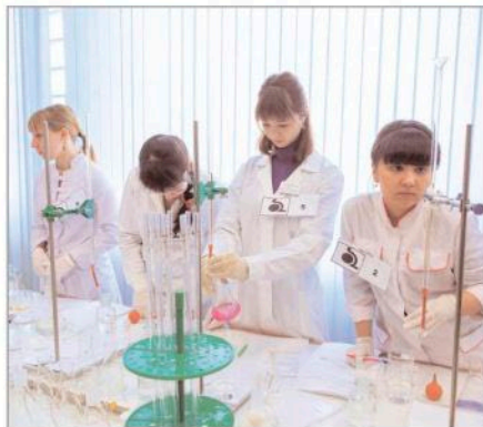
Практическое задание выполняют лаборанты химического анализа ОАО "СНХЗ"

В этом году конкурс представлял собой не только демонстрацию профессионального мастерства, но и психологическое испытание. Для конкурсантов это был период подведения итогов личных и профессиональных достижений. Конкурсные испытания позволили каждому претенденту на победу открыть в себе новые возможности самосовершенствования и самореализации. Конкурсные команды составили слесари-ремонтники, слесари КИПиА, прибористы, электромонтеры, аппаратчики, машинисты технологических насосов и компрес-