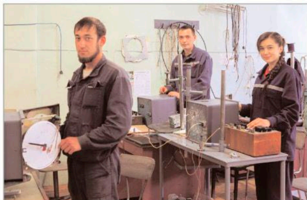
Призеры конкурса профессионального мастерства среди слесарей КИП ИСА

Все победители конкурса профессионального мастерства "Лучший по профессии" в течение года будут получать надбавку к тарифным ставкам и окладам в размере от 10 до 30% в зависимости от призового места. Мы поздравляем работников компании с отличными результатами! Без сомнения, конкурсные испытания позволили каждому претенденту на победу открыть в себе новые возможности самосовершенствования и самореализации.