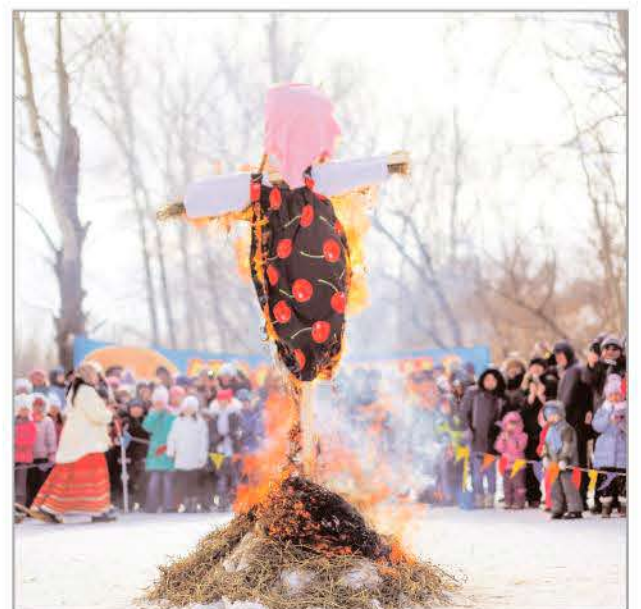
Смотрите фото- и видеорепортаж с праздника в официальной группе ГК "ТАУ" ВКонтакте - https://vk.com/gktau .