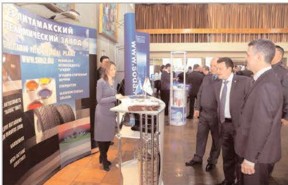
В рамках форума в фойе Городского дворца культуры была организована выставка продукции промышленных предприятий. У стенда предприятия - представители администрации Стерлитамака.

грал рост курса доллара, ориентация на импортозамещение и прогрессирующая активность предприятий химии и нефтехимии, которые реализуют долгосрочные инвестиционные проекты по реконструкции и увеличению мощностей действующих производств, программы по снижению