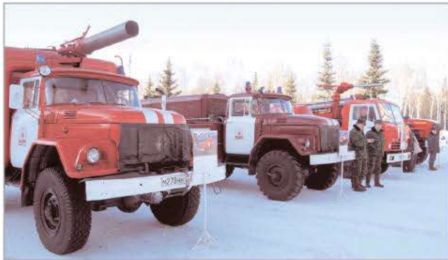
На центральной площади города был организован смотр пожарной техники и оборудования из арсенала организаций, отвечающих за безопасность граждан, в том числе и ООО "Защита".

жиров находится под угрозой. Однако пересаживаться на электротранспорт жители не спешат. Одна из причин этого - изношенность подвижного состава, на обновление которого в последние три года не выделяются средства из республиканского бюджета. В такой ситуации остается возлагать надежды на федеральное регулирование городских пассажирских перевозок, начавшееся наконец-то в России с 2015 года. Теперь все перевозчики будут подчиняться единым общероссийским правилам - ФЗ-220 от 13.07.2015 г. "Об организации регулярных перевозок пассажиров и багажа автомобильным транспортом и городским наземным электрическим транспортом в Российской Федерации и о внесении изменений в отдельные законодательные акты Российской Федерации". Закон обязывает перевозчиков работать только по контрактам с муниципальной администрацией (которая будет выдавать свидетельство об осуществлении перевозок на конкурсной основе) и выпускать на линию транспортные средства, соответствующие требованиям, указанным в реестре маршрута регулярных перевозок. Для снижения "транспортной" напряженности используются разные меры, в том числе, строительство новых дорог и развязок. Так, в 2014 году был построен первый участок ул. Строителей, в нынешнем году появится второй участок (пока в бетонном варианте) с выездом на Раев-